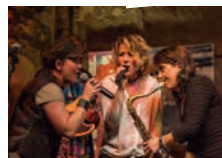
Divas Delight Soul & Pop Coverband