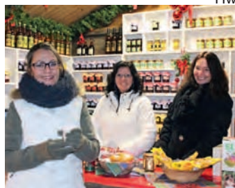
Die Honigerzeugnisse vom Höfgeshofweg waren bei den Weihnachtsmarktbesuchern sehr beliebt.